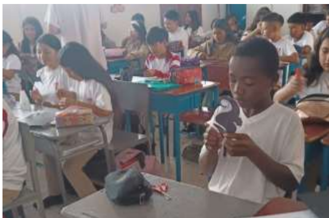
Fotografía 5: Actividad de teatro de sombras

Nota: Estudiantes organizados en dos grupos participan en una actividad de teatro debate, representando distintas posturas sobre una situación planteada, lo que favorece la argumentación, el diálogo y el respeto por las opiniones diversas.