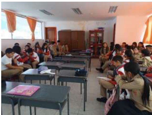
Fotografía 4: Actividad de teatro debate en grupos

Nota: Estudiantes organizados en dos grupos participan en una actividad de teatro debate, representando distintas posturas sobre una situación planteada, lo que favorece la argumentación, el diálogo y el respeto por las opiniones diversas.